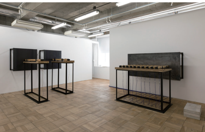
10回たたたく#1 / 10回たたたく#2 / 10回たたたく#3 2017 | nap gallery | Photo: 本城直季

今回、プラザノース開館10周年記念展となる『Domain of Art 22 タムラサトル展 Wall to Wall』では、芸術創造・ユーモアを発信する原点に再び立ち返るとともに、タムラの新たな試みに満ちた作品をご紹介します。