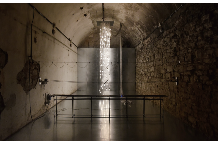
Point of Contact for Unna 2017 | INTERNATIONAL LIGHT ART AWARD 2017 Zentrum für Internationale Lichtkunst | Photo: Frank Vincken | dwb