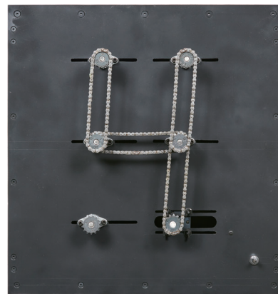
4マシン#1 2017 | TEZUKAYAMA GALLERY | Photo: 浅野豪