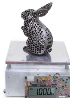
Weight Sculptures 1kg Rabbit #2 | 2004年制作